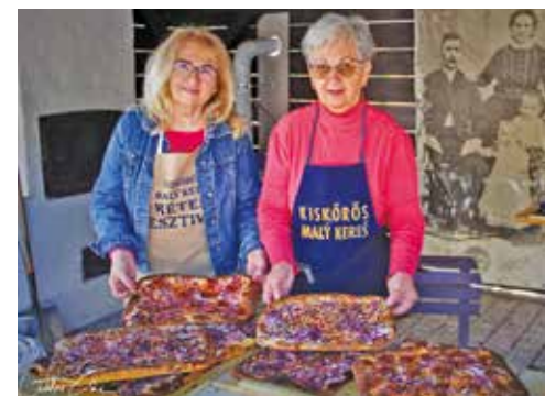
A vendégek kemencében sült kenyérlángost is kóstolhattak.

Jánosné Ica néni közreműködésével gyarapíthattuk ismereteinket őseink képfestő viseletéről. A programot az Eszterhéj zenekar fülbemászó muzsikája tette teljessé. A Tájháza és Szabadtéri Múzeumok Napján a résztvevők kemencében sült kenyérlángost fogyaszthattak, sőt, Szent György napjához, az állatok kihajtásának hagyományos időpontjához kapcsolódva állatsimogatóval is készültek a szervezők. Emellett múzeumpedagógiai foglalkozások és egy különleges fotósarok is várta az érdeklődőket a népszerű kulturális programon.