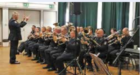
Az ünnepségen a Magyar Rendőrség Zenekarának előadását is meghallgathatta az állomány.