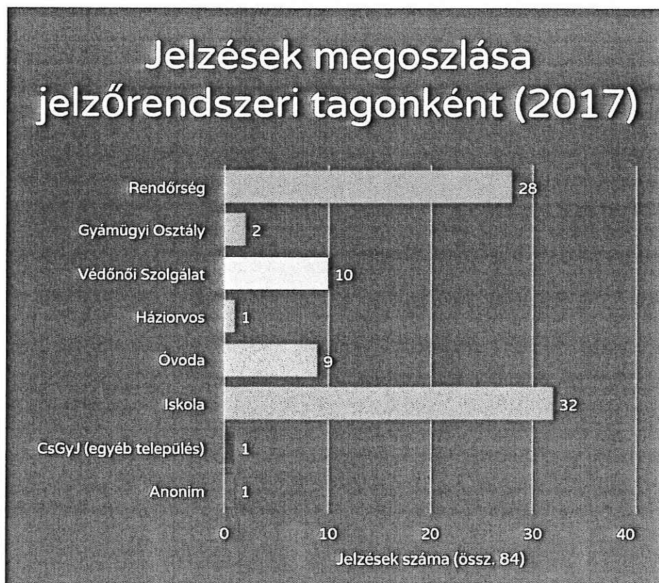
Jelzések megoszlása jelzőrendszeri tagonként (2017)

2017-ban a Család- és Gyermekjóléti Szolgálathoz összesen 84 jelzés érkezett - legtöbb esetben rendőrségtől (bűncselekmény, szabálysértés, garázdaság, stb.) a köznevelési intézményektől (igazolatlan mulasztás, magatartási problémák) és a Védőnői Szolgálattól. A Védőnői Szolgálattal 2017-ben még szorosabbá és sűrűbbé vált az együttműködés melyet jeleznek a tőlük érkező jelzések számának növekedése, az egyre több kommunikáció és a közös családlátogatások.